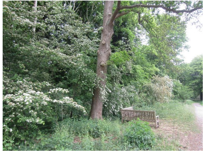
fig. 3 Eik naast pad,