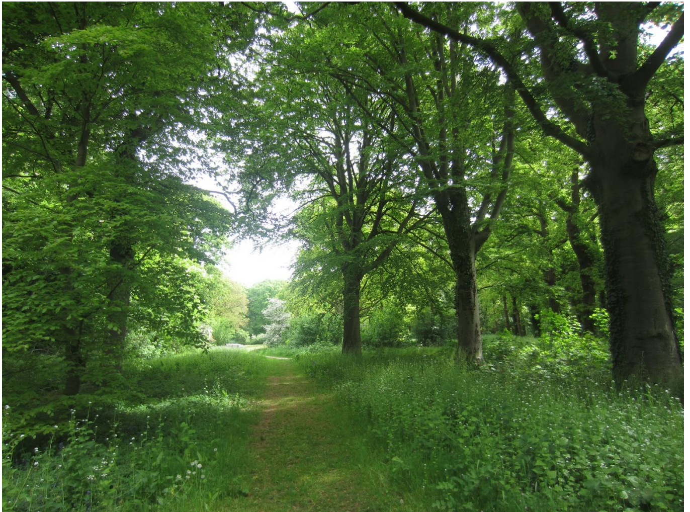
fig. 4 Fraaie, vitale beuken overgebleven van oude beukenlaan, blijven staan