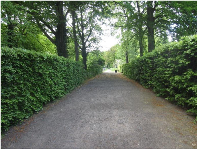
Laten staan: fig. 2 oude laanbeuken en meer recente beukenhaag