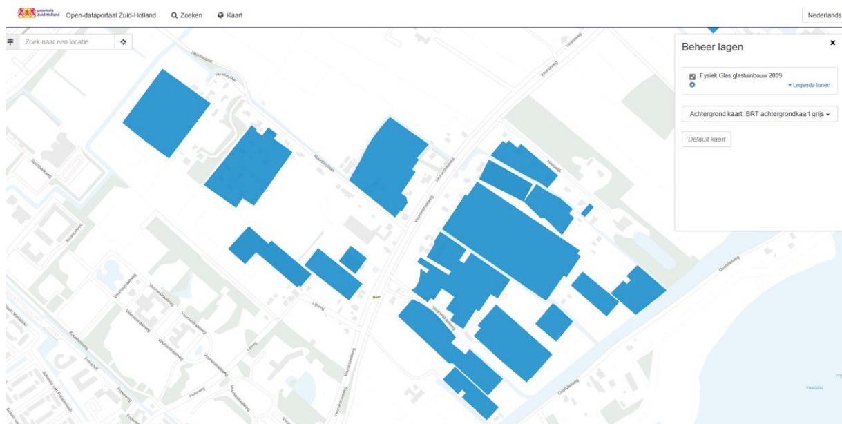
Figuur 1: Screenshot Open Dataportaal Zuid-Holland; fysiek glas 2009

Drie fracties van de gemeenteraad van LV hebben nu een vraag gesteld aan het college over deze zaak. Gezien de bespreking hiervan in de commissie Ruimte van de gemeenteraad van Leidschendam-Voorburg op 22 oktober a.s., waarbij wij gevraagd zijn in te spreken, zouden wij graag zo snel mogelijk antwoord op onze bovenstaande vragen ontvangen.