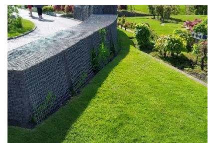
Schanskorf in Madurodam (2022)