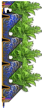
j. Greenwall construct