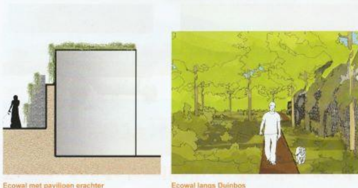
Ecowal met paviljoen erachter