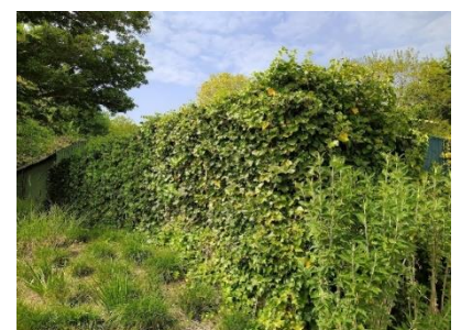
Wal met hedera in Madurodam (2022)

Januari 2017 Ontwikkelingsperspectief Madurodam 2030