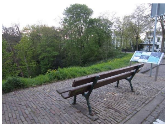
Boven de Waterpartij