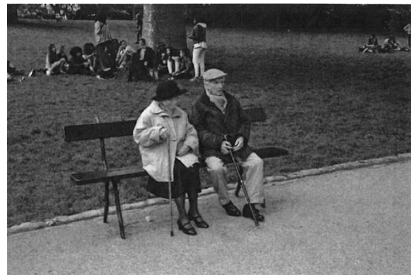
ook 19 e eeuw: Parc des Buttes de Chaumont, Parijs