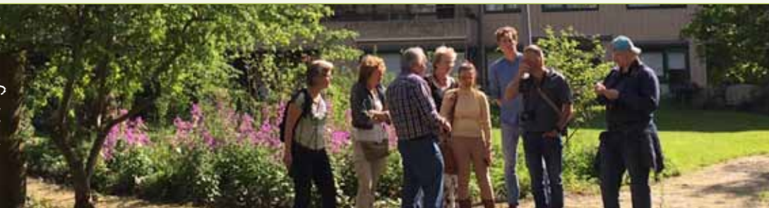
Couperusduin, D-H