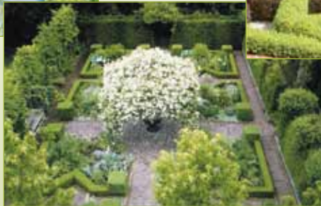
Cultuurtuin met perken, vijvers en pergola