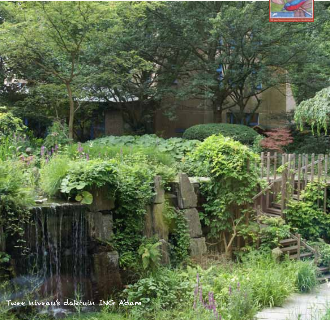
Twee niveaus daktuin ING Adam