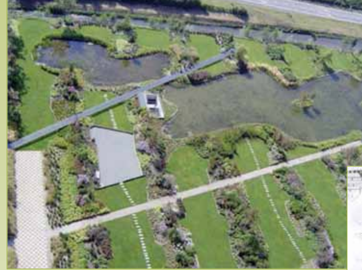
Daktuin EPO in Rijswijk bovenop parkeergarage 2,5 ha