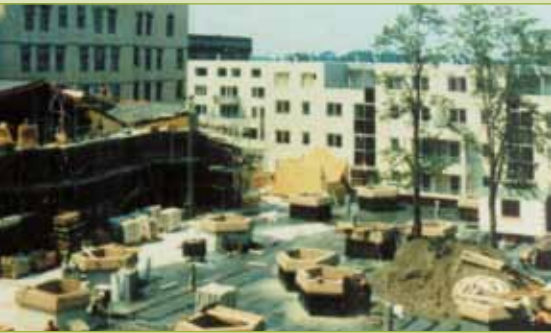
Aanleg daktuin ING, A'dam