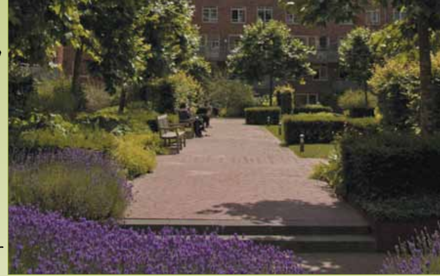
Dakpark Centre Court, Den Haag