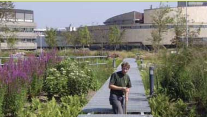
Daktuin EPO, Rijswijk