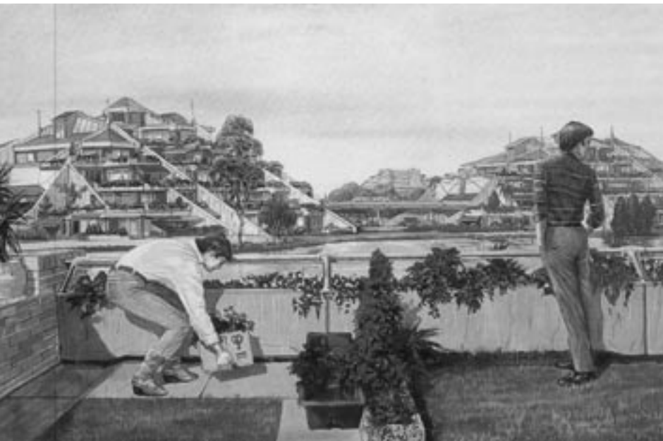
Ontwerp Piramide-woningen van Robbert en Rudolf Das. Appartementen met royale terrassen geven meer groen in de stad.