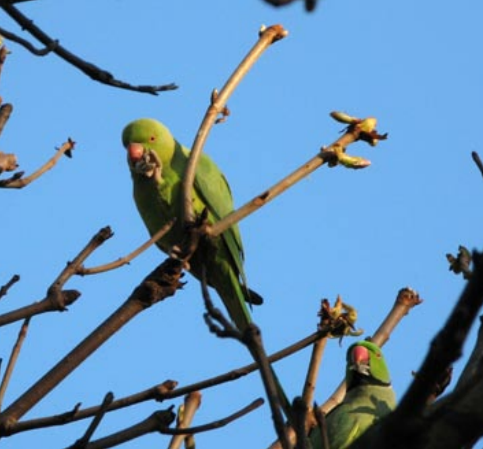
Halsbandparkieten zijn dol op knoppen en bloesem.

neerstrijken in de kruinen van een paar stadsbomen. In Amsterdam was jarenlang het Centraal Station het slachtoffer van spreeuwenmest en menig voorbijganger moest met zijn jas naar de stomerij. De spreeuw is echter een inheemse vogel en als zodanig beschermd door de Flora-en faunawet. Nu we te maken hebben met een exoot die zich in korte tijd explosief heeft vermeerderd, wordt al makkelijk gedacht om die overlast via afschot in te perken. Exoten zijn namelijk niet bij wet beschermd en als zodanig letterlijk vogelvrij. Mensen zijn sneller geneigd om ze als plaagdieren te beschouwen. Vorig jaar was er grote commotie over de vervuiling van de trottoirs voor het