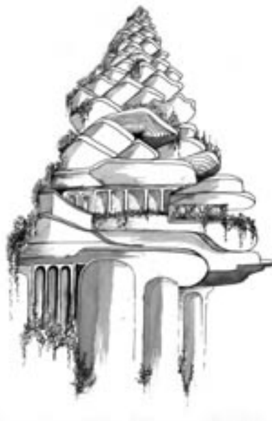
Creatief ontwerp voor terras-appartementen

Die filosofie kan men toepassen op de openbare ruimte, tuinen rond kantoren, maar ook in de eigen tuin. Hoe die zo natuurlijk mogelijk in te richten? Bodembedekkers zijn het alternatief voor “onderhoudsvrije” verharding, allerlei maatregelen zijn gunstig voor vlinders, amfibieën, vogels, vleermuizen en egels.... Daarover meer in een volgende Haagwinde ♦