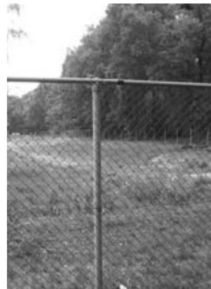
Wijndaelerplantsoen: Tussen sportveld en bos ligt een open plek, waar straks de seniorenflat gebouwd wordt. Door toedoen van de AVN is het bouwplan zo aangepast dat veel minder bomen in de bosrand gekapt hoeven te worden.

De plannen met het waardevolle bos-/duingebiedje Amonsvlakte , achter Clingendael, spelen nog veel langer, al vanaf begin jaren negentig. De AVN trekt hierbij samen op met IVN, KNNV, Stichting Duinbehoud en lokale buurt- en bewonersverenigingen. U heeft er door de jaren heen regelmatig over kunnen lezen in de vroegere Ratelaar en recentelijk in Haagwinde. In 2007 besloot de Raad van State uiteindelijk, tegen onze zin, dat er een uitbreiding van de naastgelegen golfbaan op mag worden gerealiseerd (formeel: dat het bestemmingsplan mag worden gewijzigd zodat de gemeentelijke Wassenaar voor de aanleg toestemming mag geven). Dat betekent dat onze inzet nu is om die aanleg zo natuurvriendelijk mogelijk te laten zijn, rekening houdend met de bijzondere natuurwaarde van het gebied. Zo werden er de afgelopen jaren met enige regelmaat zandhagedissen en rugstreeppadden waargenomen, en is het gebied een fourageerplaats voor vlermuizen. We vinden dat er bij het ontwerp goed rekening met specifieke biotoopeisen moet worden gehouden. Daarom hebben we erop gehamerd dat er ontheffing moet worden aangevraagd van de bepalingen van de Flora- en faunawet bij het ministerie van LNV. We verwachten dat LNV specifieke eisen zal stellen aan de aanleg, met het oog op de bijzondere diersoorten. Ook hebben we de eigenaar van het gebied, gemeente Den Haag, gevraagd om voorwaarden te stellen aan de aanlegplannen. Bij een recente hoorzitting bleek