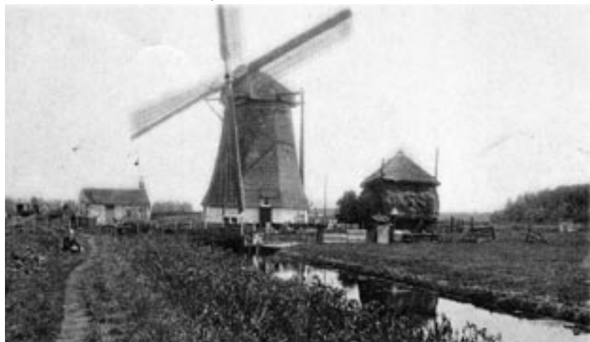
De Laakmolen in 1900

Aan de westkant van Den Haag is naar verhouding méér natuur, zelfs stukken oorspronkelijk landschap, behouden gebleven dan aan de oostkant van de stad. Daar ligt het veen dat tot ver in de 19e eeuw onbebouwd bleef. Het weidegebied met sloten en molens lag tussen de droge strandwal van Den Haag en die van Rijswijk en Voorburg. Enkele watermolens herinneren aan die situatie.