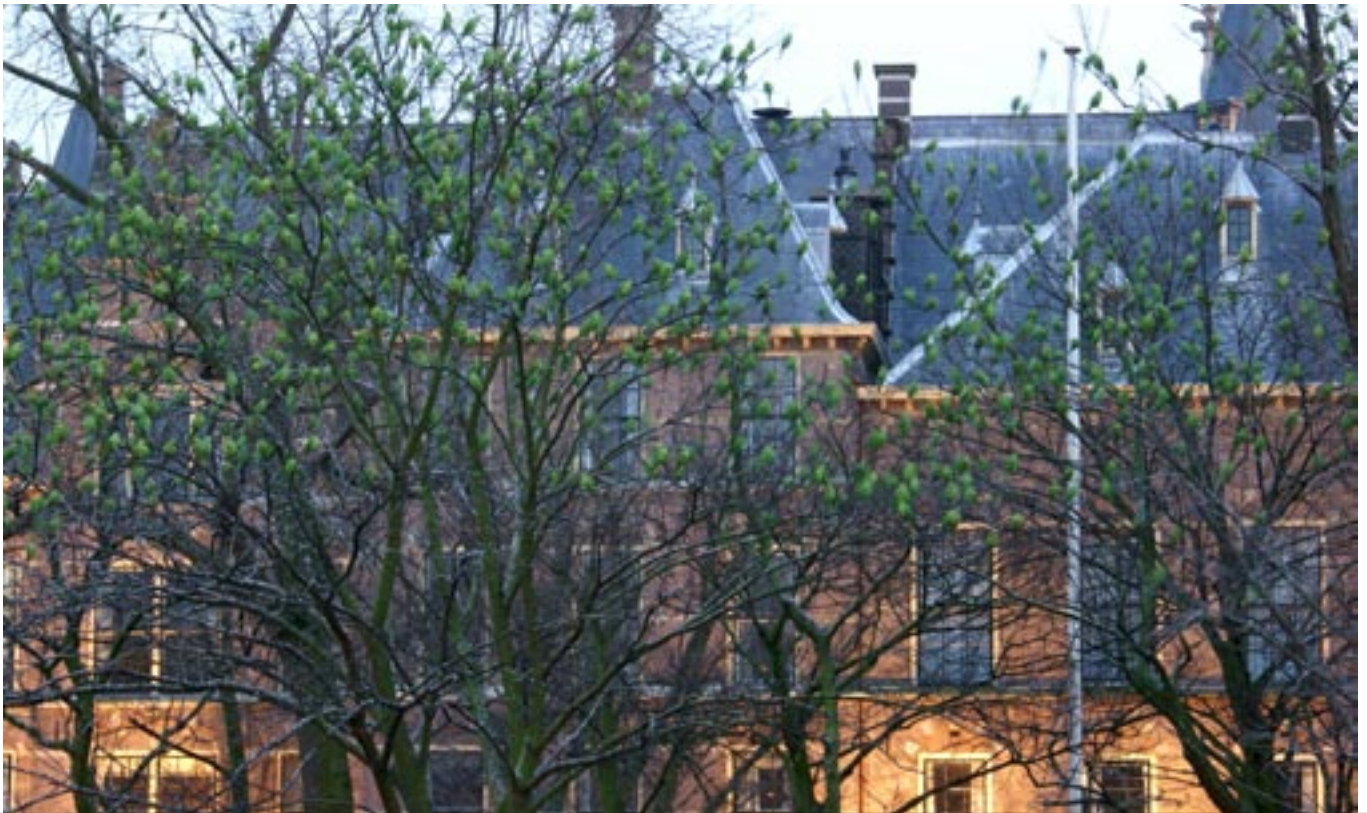
Kolonie halsbandparkieten slaapt op het eiland van de Hofvijver.

Dagelijks flitsen door het grauw van de novemberdag een tiental helgroene exotische vogels langs mijn balkon. Op jacht naar de pinda's die ik daar sinds jaar en dag voor de meesjes ophang. Met hun schelle kreten veroveren de halsbandparkieten steeds meer terrein. De mezen hebben het nakijken en scharrelen hun kostje bij elkaar tussen de kieren van de esdoornbast. Verjagen de parkieten onze inheemse vogels? Zijn ze een plaag of juist een verrijking voor de vogelstand? Het wordt hoog tijd voor een nuchtere kijk op deze tropische verrassing.