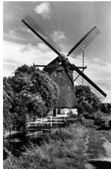
De Schenk molen in 1953

De open weilanden met koeien tussen Den Haag, Rijswijk en Voorburg zijn er niet meer, maar de kenmerkende poldermolens zijn als een herinnering aan dat landschap bewaard gebleven ♦