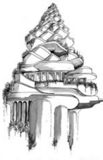
Creatief ontwerp voor terras-appartementen

Die filosofie kan men toepassen op de openbare ruimte, tuinen rond kantoren, maar ook in de eigen tuin. Hoe die zo natuurlijk mogelijk in te richten? Bodembedekkers zijn het alternatief voor “onderhoudsvrije” verharding, allerlei maatregelen zijn gunstig voor vlinders, amfibieën, vogels, vleermuizen en egels.... Daarover meer in een volgende Haagwinde ♦