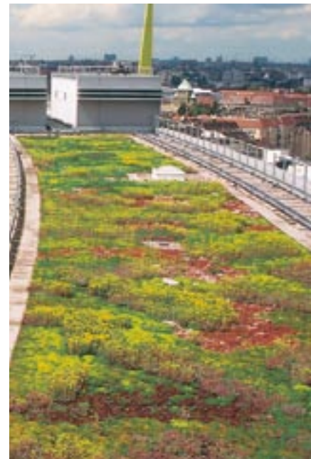
Sedum is prima geschikt als dakdekking en goed bestand tegen extreme omstandigheden.

De futurologen Rudolf en Robbert Das hebben woonpiramides ontworpen met ruime balkons, waarvan er in Houten één is gerealiseerd. Architect Emilio Ambasz ontwierp ook gebouwen die zo goed in het landschap passen, dat je ze bijna niet meer ziet. Goed te gebruiken voor gebouwen die in of naast natuurgebieden worden gebouwd. Zou het niet mooi zijn als het Internationaal Strafhof, dat op de grens met de Oostduinen wordt neergezet, zo wordt gebouwd dat het zou smelten in zijn omgeving?